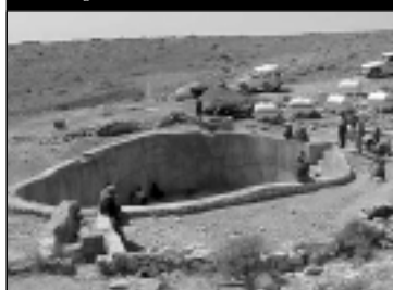
Karif, réservoir d'eau douce traditionnel