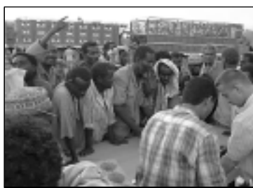
Consultation entre Triangle et les réfugiés somaliens