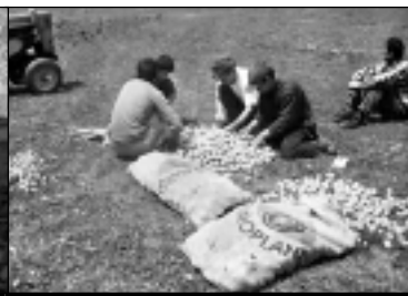
Technique de production