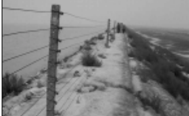
Réhabilitation de dix kilomètres de digues

C'est en décembre 2000 que Triangle débute ses activités en Corée du Nord avec un programme d'appui au secteur agricole. L'association intervient aujourd'hui dans 4 domaines : distribution d'eau et assainissement, réhabilitation de polder 1 , reboisement et isolation des institutions scolaires et de santé. Ces projets, principalement basés sur le transfert de technologie, sont concentrés en milieu rural.