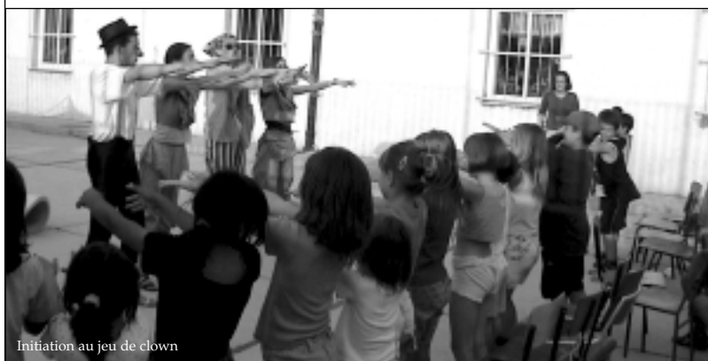
Initiation au jeu de clown

La république Fédérale de Yougoslavie est "morte". Cette puissance, regroupant depuis 1945 six républiques et deux provinces autonomes, s'est doucement éclatée pour ne réunir plus que deux territoires.