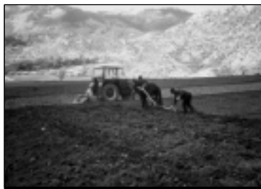
L'agriculture albanaise en transition