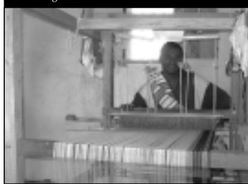
Activités génératrices de revenus