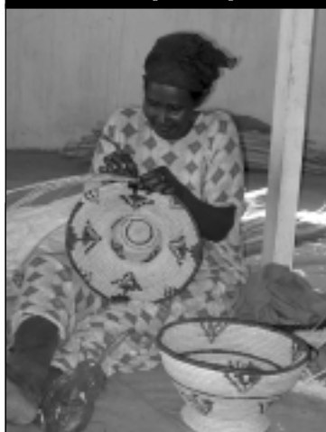
Activités génératrices de revenus