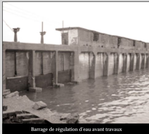
Barrage de régulation d'eau avant travaux

sant la digue verticalement côté mer. Ces travaux de confortement n'étaient cependant pas suffisants pour résister à un autre raz de marée, et leur maintenance laissait à désirer. Les deux ouvrages de vannage, situés au nord et au sud du polder, qui ont été construits à la même époque que la digue, n'ont pas été entretenus et sont aujourd'hui dans un état de délabrement avancé. Seules quelques vannes fonctionnent encore, et leur étanchéité n'est plus effective, laissant à chaque marée haute de l'eau de mer venir polluer l'eau destinée à l'irrigation des cultures.