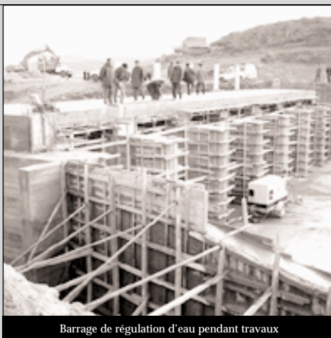
Barrage de régulation d'eau pendant travaux

Le matériel et les matériaux ont été choisis en coopération avec nos différents partenaires coréens par rapport aux besoins du projet, c'est-à-dire par rapport aux différents chantiers mis en œuvre (digue, ouvrages de vannage, carrières).