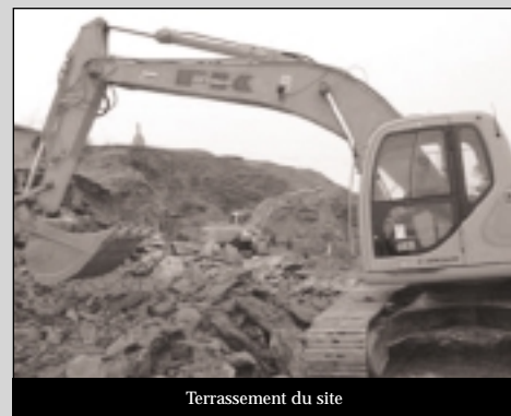
Terrassement du site