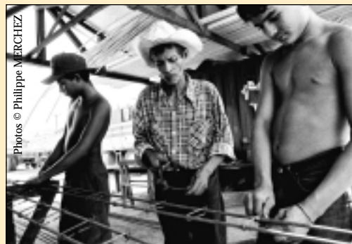
Honduras 1998, Programme de reconstruction