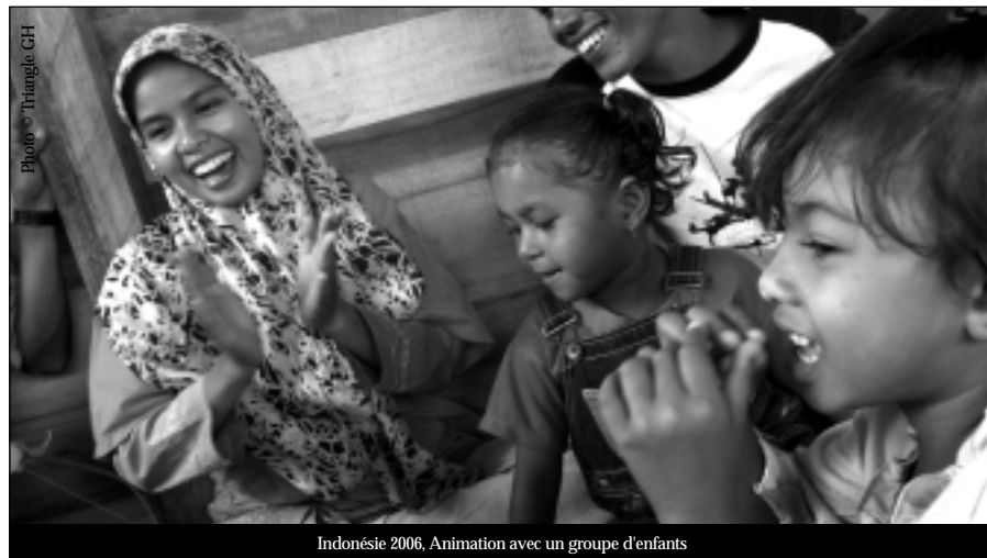
Indonésie 2006, Animation avec un groupe d'enfants