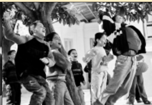
Algérie 2003 - Enfants de l'école du quartier de Belouizdad

mentaires ont permis à de jeunes albanais de retrouver un cadre plus serein. Au Kosovo, l'accent a été mis sur le soutien psycho-social auprès des adolescents par des activités extra-scolaires encadrées et la création d'un centre communautaire à Skenderaj. Un soutien psychologique a été apporté dans des camps de réfugiés.