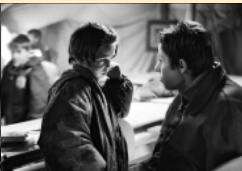
Kosovo 1999, Programme psychosocial