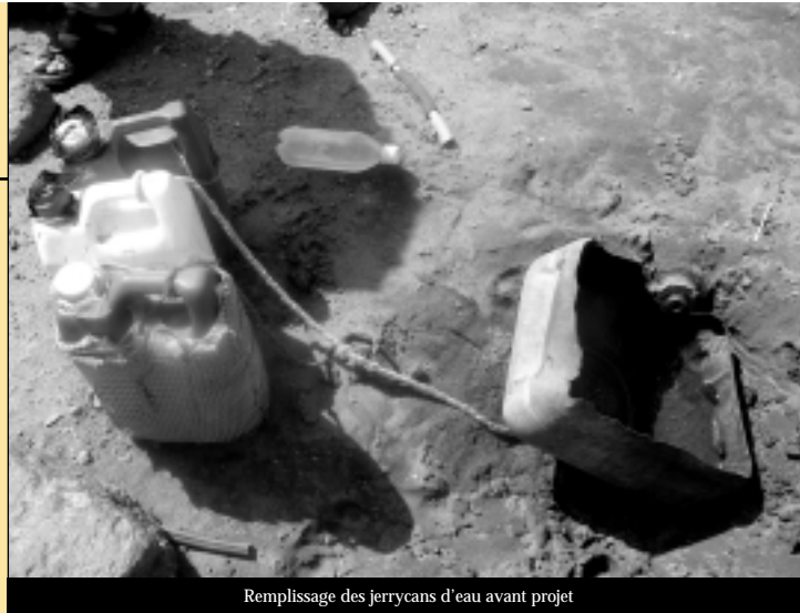
Remplissage des jerrycans d'eau avant projet

Mais la tâche n'est pas simple. Il ne suffit pas de distribuer des messages tout prêts qui ne seraient pas adaptés et croire que de nouvelles