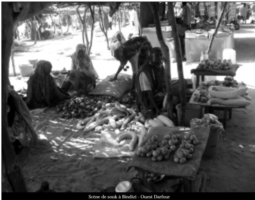
Scène de souk à Bindizi - Ouest Darfour