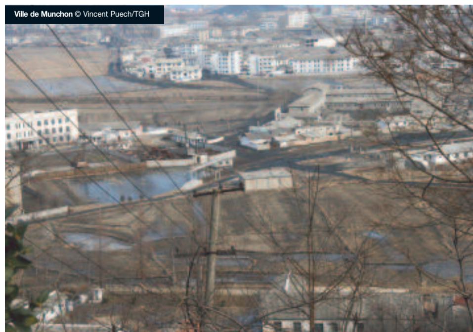
Ville de Munchon

Munchon, ville de 42.000 habitants de la côte est de la Corée, bénéficie depuis 2004 d'un programme de réhabilitation du réseau d'eau. Cette opération financée par le bailleur européen ECHO 1 est mise en œuvre par Triangle GH.