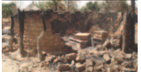
Birao après les combats de mars 2007