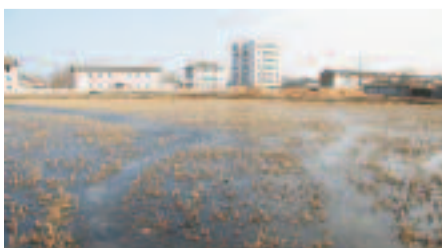
Ville de Munchon

Lorsqu'on y travaille, c'est au quotidien que l'on se retrouve confronté à cette réalité. Pour commencer, contrairement aux pays dans lesquels