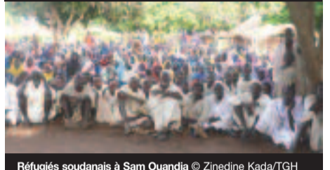
Réfugiés soudanais à Sam Ouandja