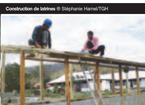
Construction de latrines