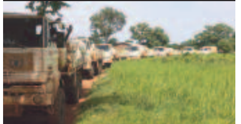
Arrivée d'un convoi d'aide à Sam Ouandja