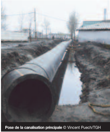
Pose de la canalisation principale

Durant la première phase (de novembre 2004 à juin 2006), deux réservoirs de respectivement 300 m 3 et 1000 m 3 ont été réalisés ainsi que 4 nouvelles stations de pompage qui ont nécessité le forage de 9 forages en milieu alluvial. A