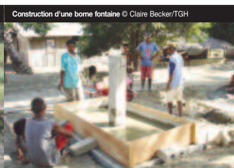
Construction d'une borne fontaine