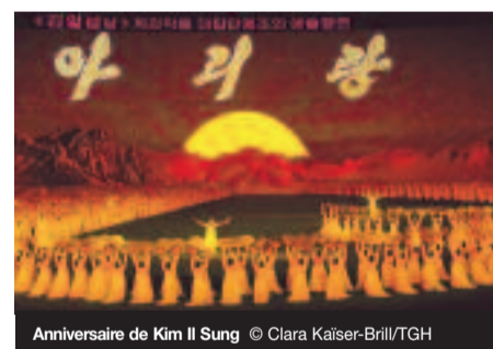
Anniversaire de Kim Il Sung

nautaire. Cette dernière est plus dure à capter. On la perçoit dans quelques regards échangés sur le terrain avec les ouvriers et on la devine dans les familles qui depuis longtemps n'avaient pas vu couler l'eau à leur robinet.