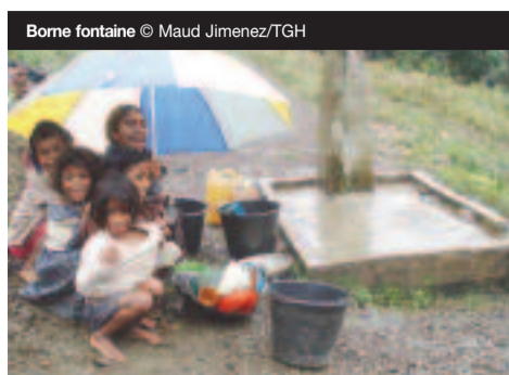
Borne fontaine

C'est toujours dans ce district, à la demande du Gouvernement du Timor Oriental, et avec le soutien de l'Ambassade de France à Jakarta, que Triangle GH participe à un vaste programme visant la réhabilitation, la maintenance et la gestion des réseaux d'eau. L'objectif de la première phase de ce projet actuellement en cours est de réaliser un état des lieux et une évaluation approfondie de la situation des réseaux d'eau ruraux existants afin de proposer ensuite des solutions pour qu'à terme tous les systèmes d'approvisionnement en eau du district fonctionnent complètement, soient gérés correctement et bénéficient d'un système de soutien externe qui assure leur viabilité. ■