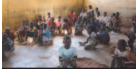
Scène de classe à Birao

Vous trouverez sur le site de Triangle GH www.trianglegh.org toutes les informations relatives à nos programmes en RCA